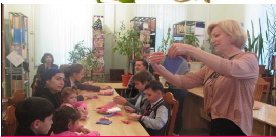
Районная детская библиотека