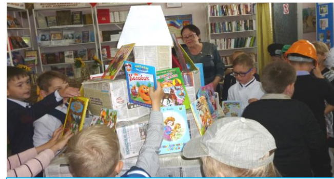
Галюгаевский филиал № 1

Библионочь « Волшебный мир книги » в Балтийской библиотеке состояла из 2-х этапов: днём на свежем воздухе прошла игра «Школа книжного волшебства» для детей 8-12 лет. Здесь ребята познакомились с ведущими Ягущечкой и Василисой, отвечали на вопросы викторин и выполняли задания четырёх стихий, читали стихи и рисовали магические предметы. Проходили эстафеты «Волшебный клубочек», «Цветочная поляна», «Волшебная река сказок» и другие. Дети собрали фразу «Читать – здорово!» из листочков с буквами, за что получили сладкие призы. В завершении мероприятия детей порадовала книжная выставка-сюрприз «Прочитай то, не знаю что» (Букскрессинг). Вечером начался 2-й этап праздника «Волшебный мир Тургенева» для молодёжи. Помещение библиотеки было оформлено в виде литературного кафе «В Тургеневском стиле». Гостей встречала Ася