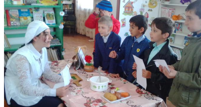
Пролетарский филиал № 19

В Галюгаевской библиотеке состоялись Библиосумерки « Да здравствует читающий народ! », которые начались с акции «Галюгаевцы – читающий народ» на абонементе библиотеки. Специалисты предложили ребятам полистать самые интересные книжки из фонда, познакомили с творчеством любимых всеми писателей: Самуила Маршака, Сергея Михалкова, Агнии Барто. Дети с удовольствием декламировали стихи, а на импровизированную пирамиду расставили лучшие, по их мнению, книги. Затем, переодевшись в костюмы, инсценировали стихотворение Владимира Маяковского «Кем быть?», отвечали на вопросы викторины о профессиях и нарисовали рисунки на тему «Угадай профессию».