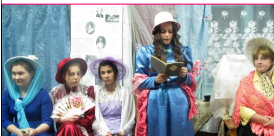
Ростовановский филиал № 18