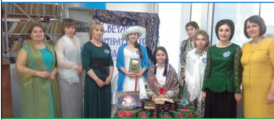
Центральная районная библиотека