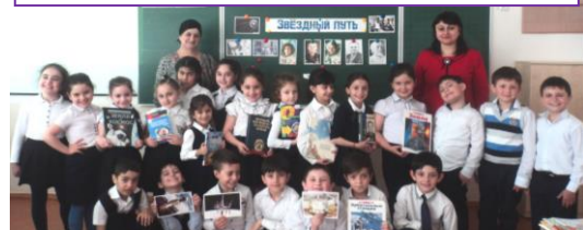
Эдиссийский филиал № 11