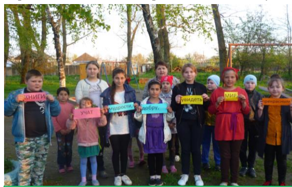
Новодеревенский филиал № 10

В Винсовхозской библиотеке прошла Библионочь на тему « Магическая библиотека ». Программа состояла из квеста «Охотники за книгами», мастер-класса по изготовлению значков ко Дню Победы, а также блицтурнира «Моё любимое классическое произведение», где присутствующие разделились на две команды и отвечали на вопросы по произведениям русских писателей.