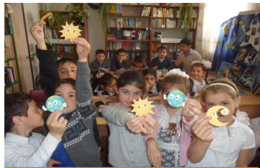
Пролетарский филиал № 19