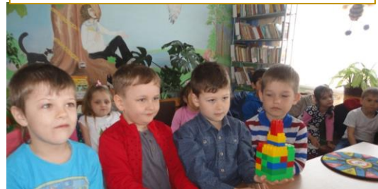
Балтийский филиал № 23