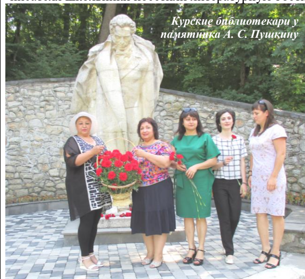
Курские библиотекари у памятника А. С. Пушкину