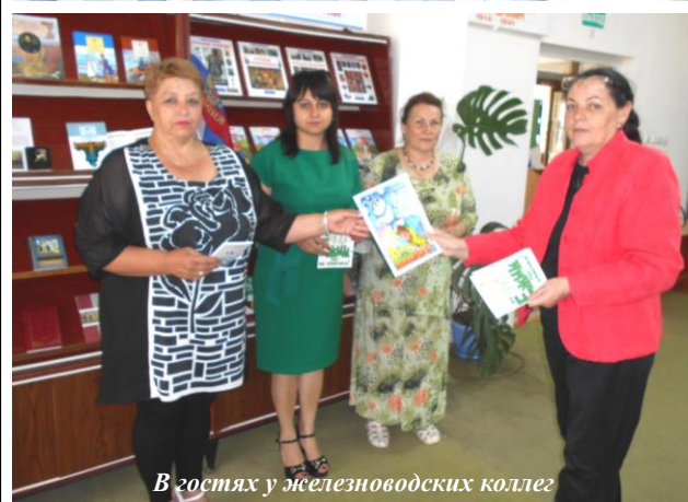
В гостях у железноводских коллег