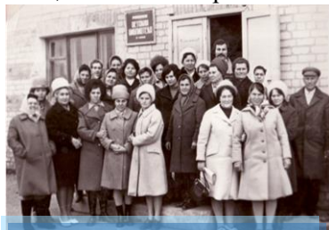
Семинар библиотекарей (1980)