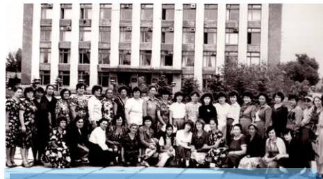
Коллектив Курской ЦСБ (1986)