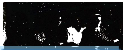
Коллектив районной библиотеки (1955)