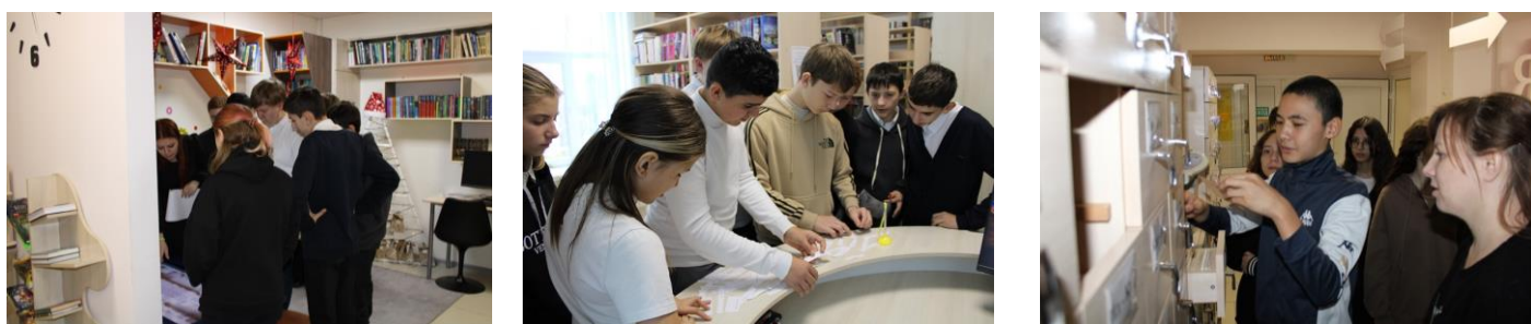
График работы библиотек в Новогодние и праздничные дни

В центральной районной модельной библиотеке прошло литературное путешествие «Учителя на страницах книг» , посвящённое Году педагога и наставника. Участники мероприятия, разделившись на команды, отправились в путешествие по литературным станциям. На станции « Библиотечный каталог » ведущий библиограф познакомил ребят с систематическим и алфавитным каталогами, рассказала о правилах расстановки карточек в каталогах и как с ними работать. Затем ребята выполнили поиск писателей-педагогов по картотеке. Далее участники игры отвечали на вопросы викторины «Учителя + Книги» . За 3 минуты собирали правильные пары из карточек с именами авторов и отдельно с названиями произведений, решали ребусы, в которых были зашифрованы фамилии поэтов. Читатели показали хорошие знания в области классической литературы и получили заряд хорошего настроения.