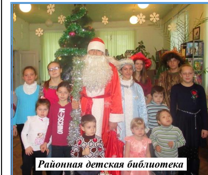
Районная детская библиотека

В период рождественских праздников библиотекари района с энтузиазмом взялись за организацию полезного досуга пользователей и подготовили ряд интереснейших мероприятий: